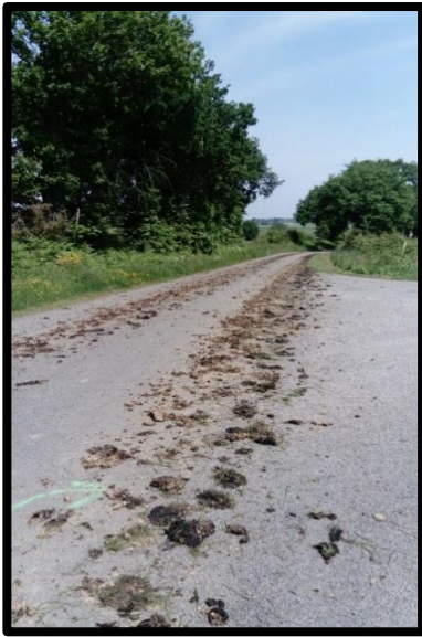
Constaté sur une route de St Michel