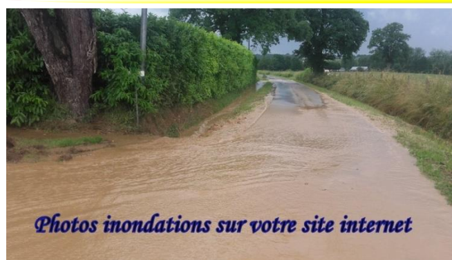
Photos inondations sur votre site internet

Le site Internet évolue, vous pouvez aussi donner votre avis ou demander une rubrique, contactez-nous.