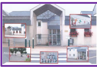
Ecole publique St Aignan sur Roë

Pour toute inscription pour la rentrée prochaine, vous pouvez envoyer un mail à l'adresse suivante :