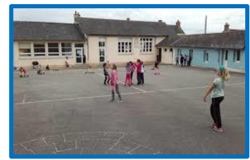
Ecole Sacré Cœur St Aignan sur Roë